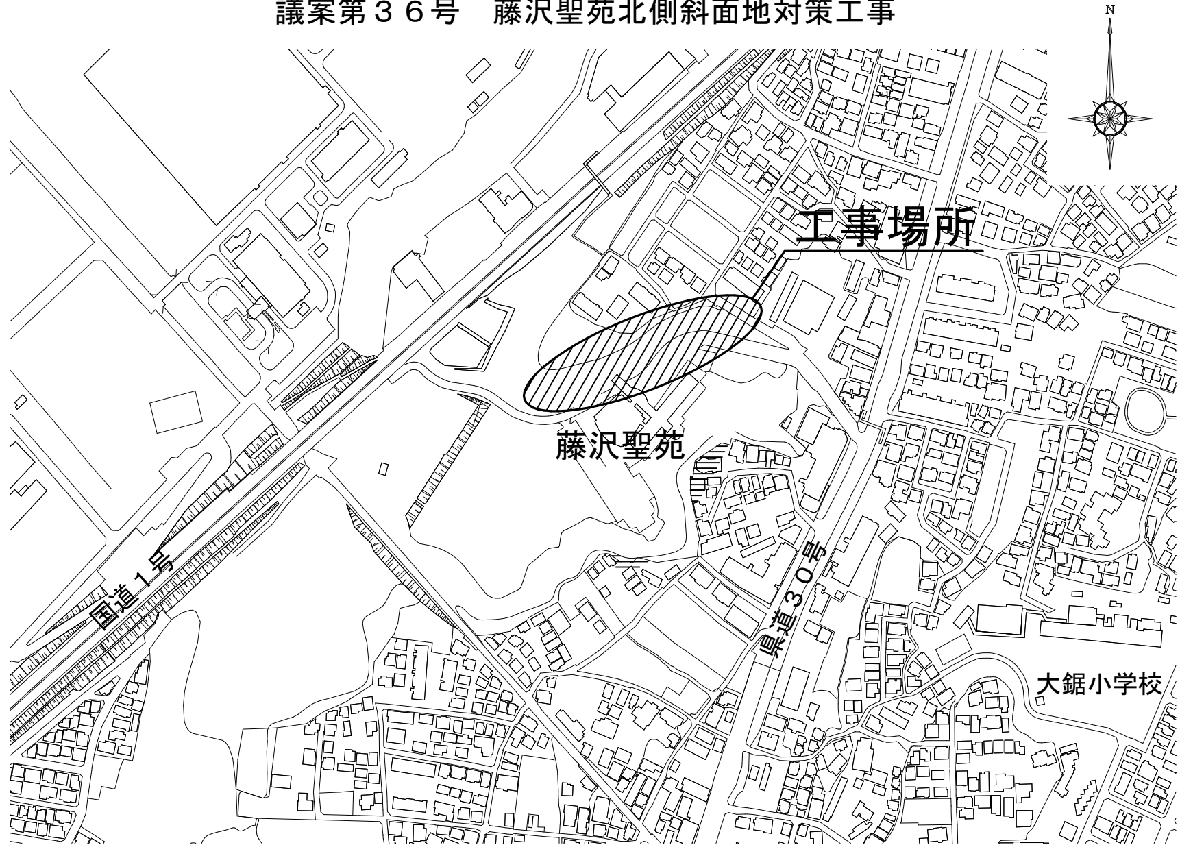
案内図 NON SCALE