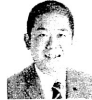
藤沢市議会議員 味村耕太郎