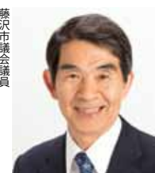
藤沢市議会議員 山内 幹郎