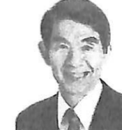
藤沢市議会議員 山内 幹郎