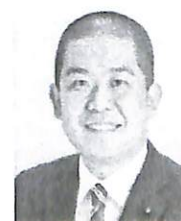
藤沢市議会議員 味村耕太郎